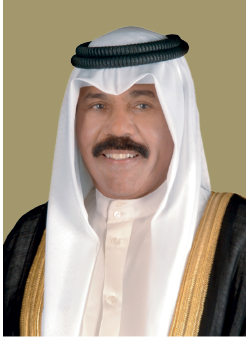
حضرة صاحب السمو الشيخ نواف الأحمد الجابر الصباح أمير دولة الكويت