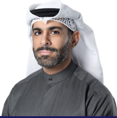
السيد/ فيصل عبدالرزاق النصار رئيس المجموعة المصرفية للشركات