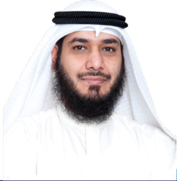
فضيلة الدكتور / عصام خلف العنزي رئيس هيئة الفتوى والرقابة الشرعية

الدكتور عصام خلف العنزي هو أحد أعضاء هيئة التدريس بكلية الشريعة والدراسات الإسلامية بجامعة الكويت. حصل على درجة الدكتوراه في الفقه الإسلامي من جامعة الأردن، ودرجة الماجستير في الشريعة الإسلامية من جامعة الكويت. وهو عضو في العديد من مجالس الشريعة البارزة كهيئة المحاسبة والمراجعة للمؤسسات المالية الإسلامية (AAOIFI) وبنك البحرين الإسلامي ودار الاستثمار وبنك وربة وبنك بوبيان والأهلي المتحد.