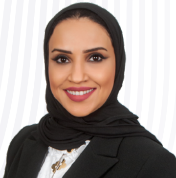
السيدة/ معالي عبدالله الرشيد رئيس مجموعة الموارد البشرية والخدمات العامة