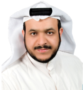
فضيلة الدكتور / محمد عود الفزيع عضو هيئة الفتوى والرقابة الشرعية

ويعتبر الدكتور العنزي أحد المتحدثين الدائمين في المؤتمرات والندوات التي تركز على كل من المالية والفقه الإسلامي. وقد قام أيضًا بنشر العديد من الأبحاث التي تتناول القضايا المتعلقة بالأعمال المصرفية والمالية الإسلامية.