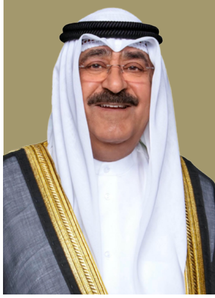
سمو الشيخ مشعل الأحمد الجابر الصباح ولي العهد