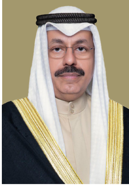
سمو الشيخ أحمد النواف الأحمد الصباح رئيس مجلس الوزراء