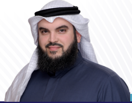
السيد / ثويني خالد الثويني رئيس المجموعة المصرفية للاستثمار